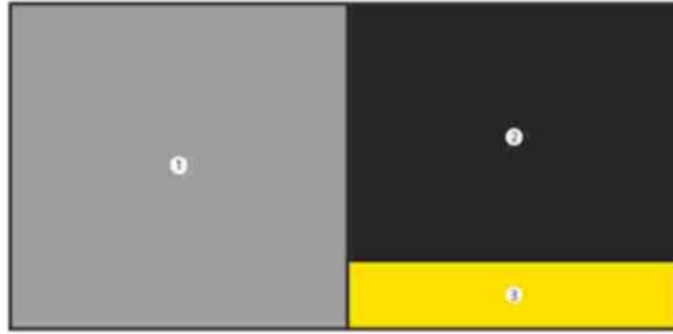
الشكل 2 - نمط متجانب - 1: الصورة، 2: العبارة، 3: رسالة الإقلاع

ج- في حال كان ارتفاع التحذير الصحي أعلى من 65% لكن أقل أو يساوي 70% من عرضه، فالإمكان وضع التحذير على نمط متتابع أو متجانب شريطة أن تكون جميع عناصر التحذير الصحي مرئية وغير مشوهة.